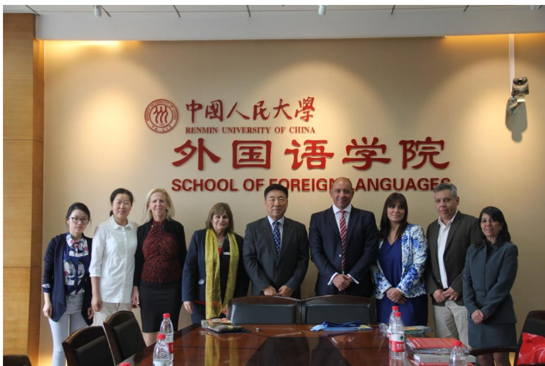
(图2 参会人员集体合影)