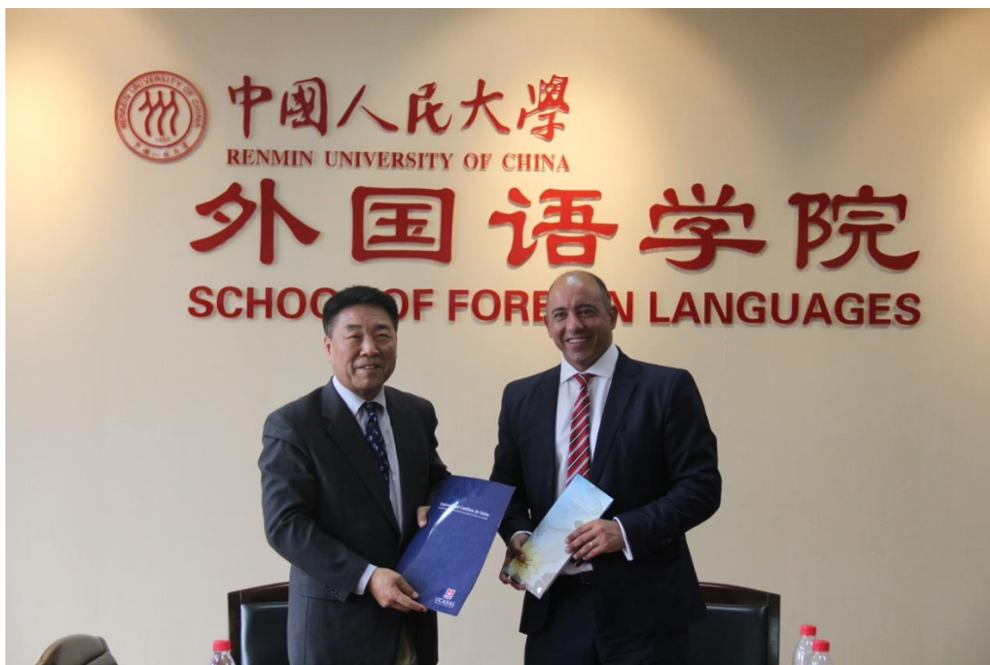
(图1 双方领导签署合作框架协议)