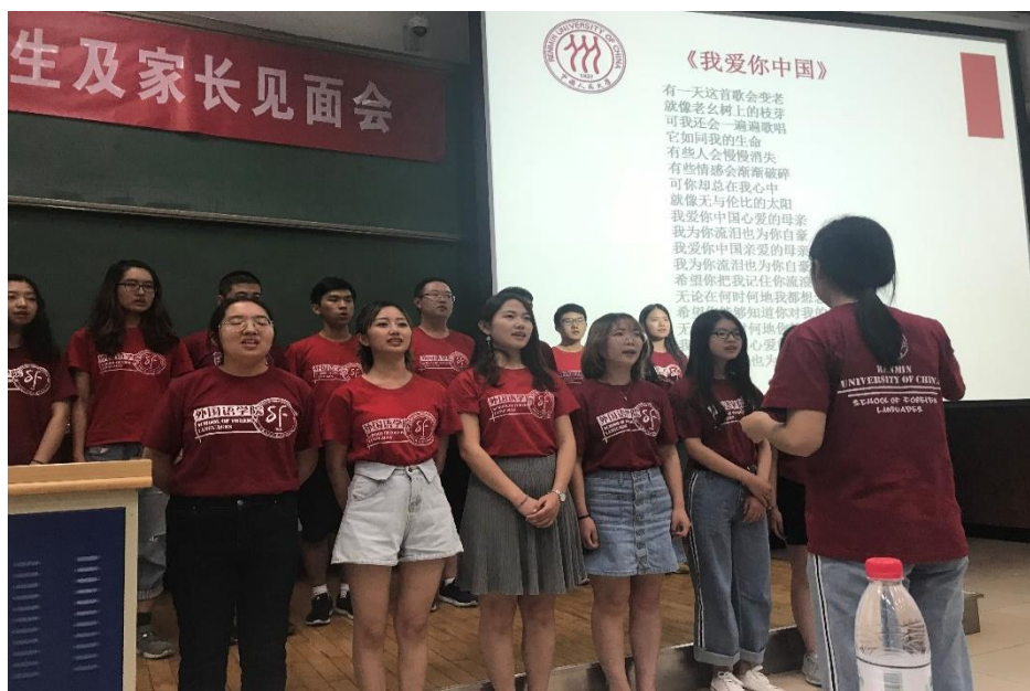
军训归来的2017级本科生为新生带来合唱

见面会在2017级同学们的歌声中拉开序幕。合唱《陕北公学校歌》将大家带回到战火纷飞的革命岁月，也让在场的师生一同回顾了人民大学走过的光辉岁月。歌曲《我爱你中国》则唱出了人大学子对国家的热爱，体现出“国民表率，社会栋梁”的责任担当。