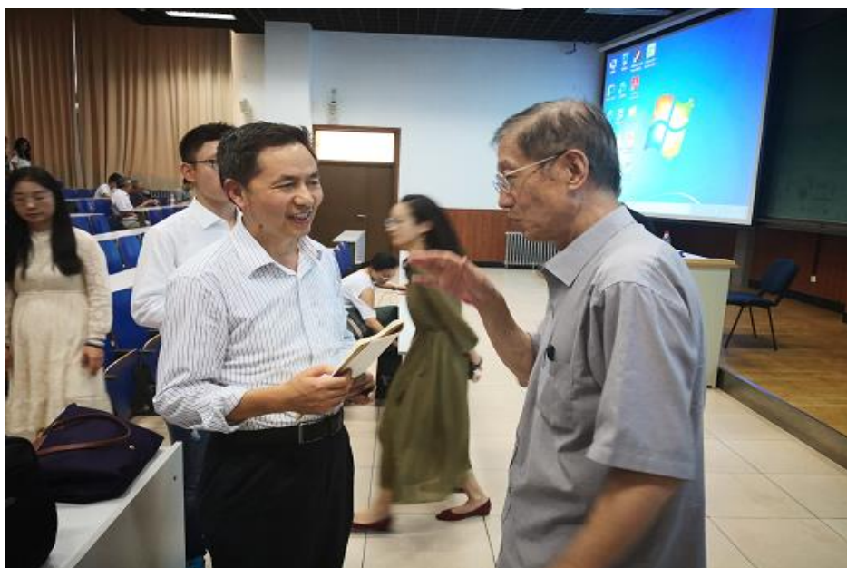
(撰稿人：刘新风 高方圆)

在讲座中，陈明明教授从自身丰富的外交工作经历出发，结合生动的实例为大家上了一堂妙趣横生的英语演讲课。本次讲座主要分为两部分：(1) 用英语做演讲须遵循的十大原则；(2) 结合大使致辞对上述原则进行实例剖析。陈明明教授强调，我们在英语演讲时语速宜慢、吐字清晰，避免说教式表达，尽量做到风趣幽默、言之有物，能够引起听众的情感共鸣。