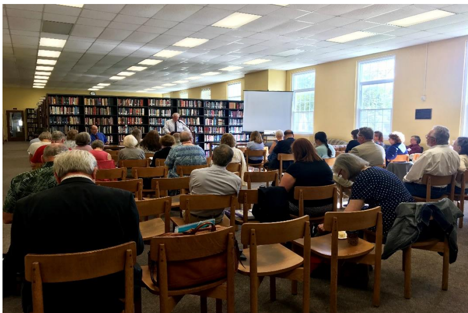
美国赛珍珠国际会议现场一角

赛珍珠（Pearl S. Buck, 1892-1973）是美国著名女作家，1938年诺贝尔文学奖得主。曾经在中国生活了35年。她一生中的绝大部分作品都与中国有关。其代表作《大地》三部曲被誉为是真实地描写了中国农民的生活；《龙子》是英语世界中最早向世界揭露日本侵略中国并反映南京大屠杀的文学作品，也是反映中国人民抗日战争的抗鼎之作。