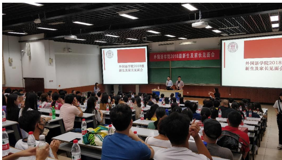
新生及家长见面会现场

见面会在2017级同学们的歌声中拉开序幕。合唱《陕北公学校歌》将大家带回到战火纷飞的革命岁月，也让在场的师生一同回顾了人民大学走过的光辉岁月。歌曲《我爱你中国》则唱出了人大学子对国家的热爱，体现出“国民表率，社会栋梁”的责任担当。