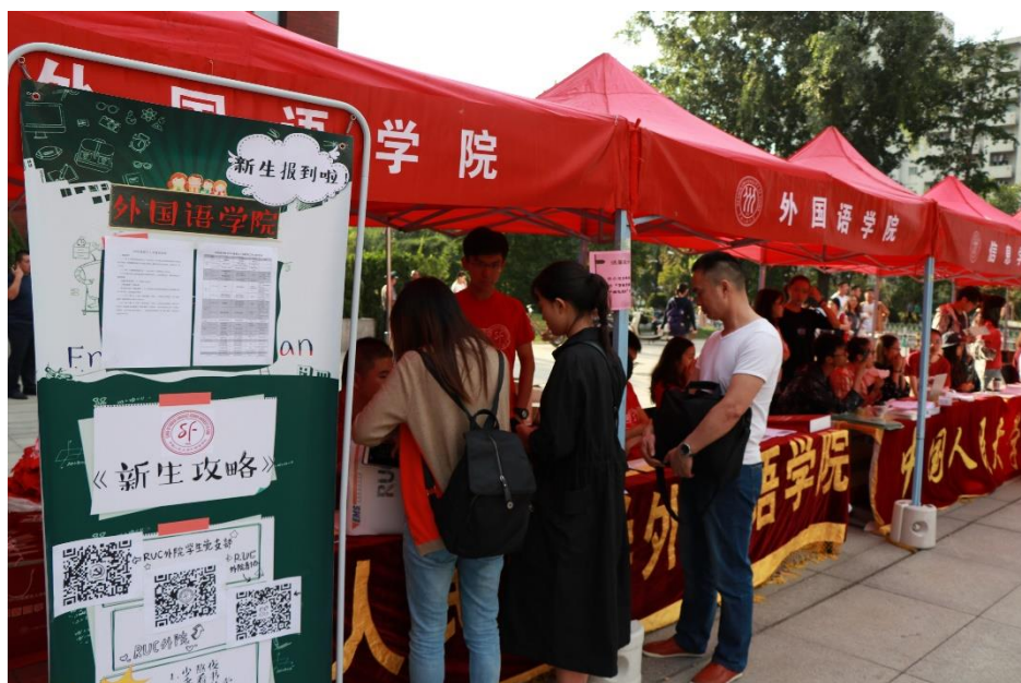
外院迎新活动现场

外院2018级新生共有248名，其中本科生120人，硕士研究生106人（其中，学术型硕士85人，专业学位硕士21人），博士研究生17人，国际学生5人。