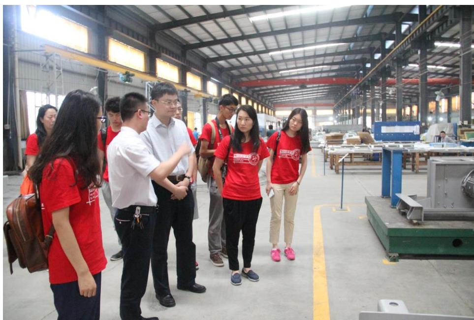
(实践团在时代金属制造有限公司的冷却器生产车间参观)

参观新农村建设是这次教育实践活动的一项重要内容，为此实践团来到栗山坝镇东岗村参观学习。东岗村文化广场是当地公共文化服务建设的亮点，每到夜晚当地农民自发组织的群众文化活动在这里热闹上演，表达了对幸福生活的赞美。近年来，东岗村不断壮大村集体经济，修路搭桥、整洁村容村貌，在村里先